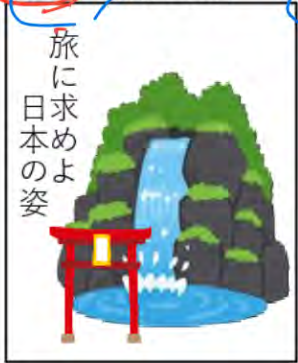
【資料1】 1938年の政府の広告